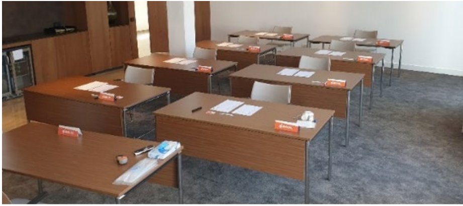
Afbeelding 1.1: Foto opstelling trainingsruimte